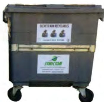
BAC GRIS : ORDURES MENAGERES

Coût du traitement pour 1 Tonne : 146,30 TTC €