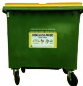
BAC VERT : TRI SELECTIF

Coût du traitement pour 1 Tonne : 60,50 TTC €